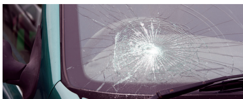
Vitre écaillée ou fissurée