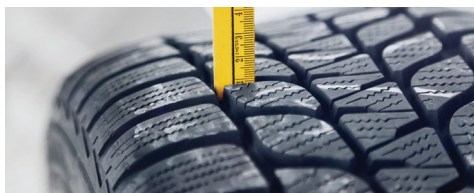
Pneus et roues